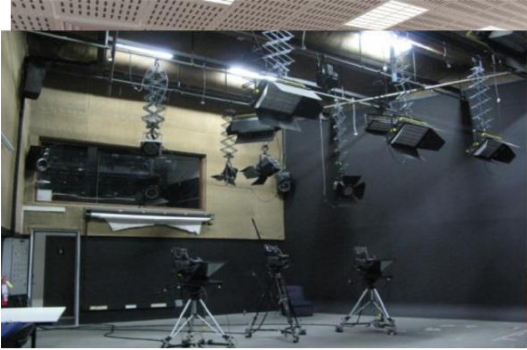
Renovación de Auditorios y Aulas Magnas